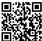
HP mobile printing